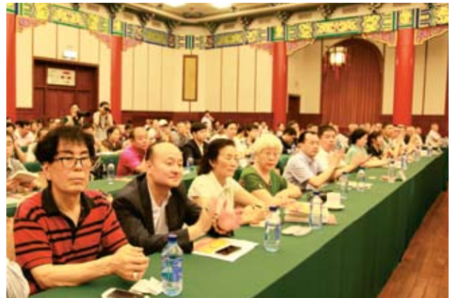
出席座谈会的企业家。