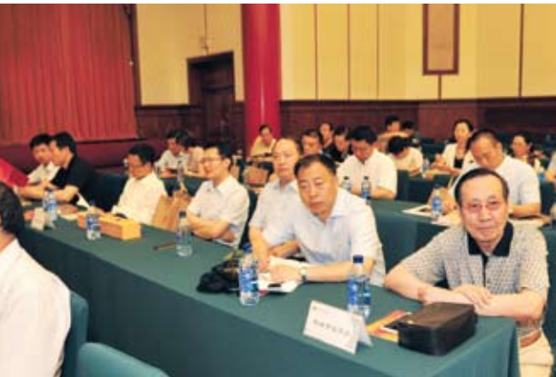
出席座谈会的企业家和合作伙伴代表等。