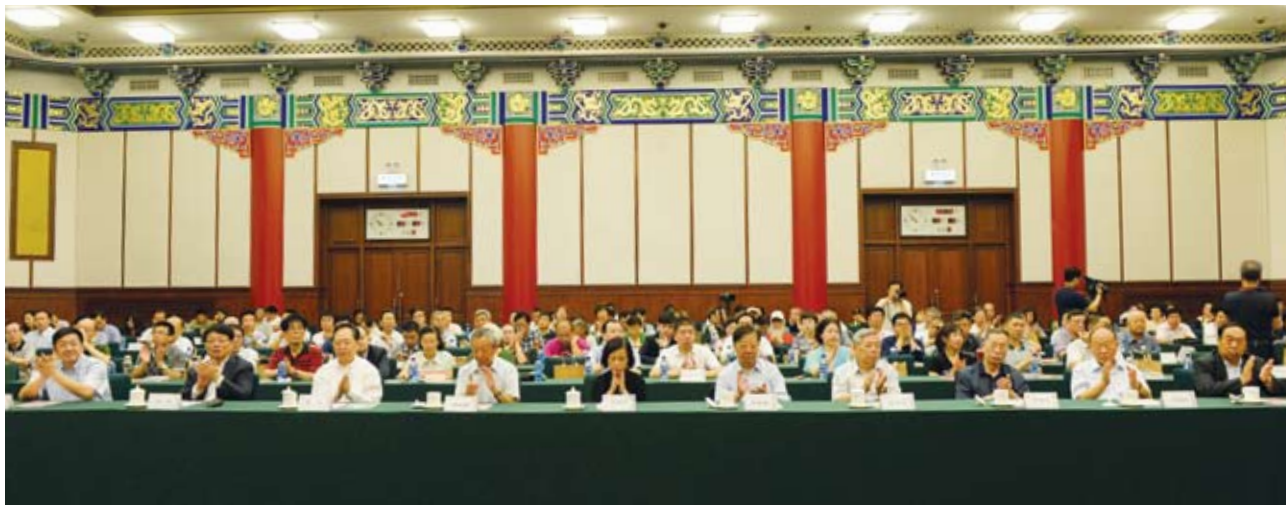
在主宾席上就座的领导（前排左起）：王兵、洪崎、吕波、曾玉康、李泊溪、许海峰、纪明波、李岩岭、朱继民、甘连舫。