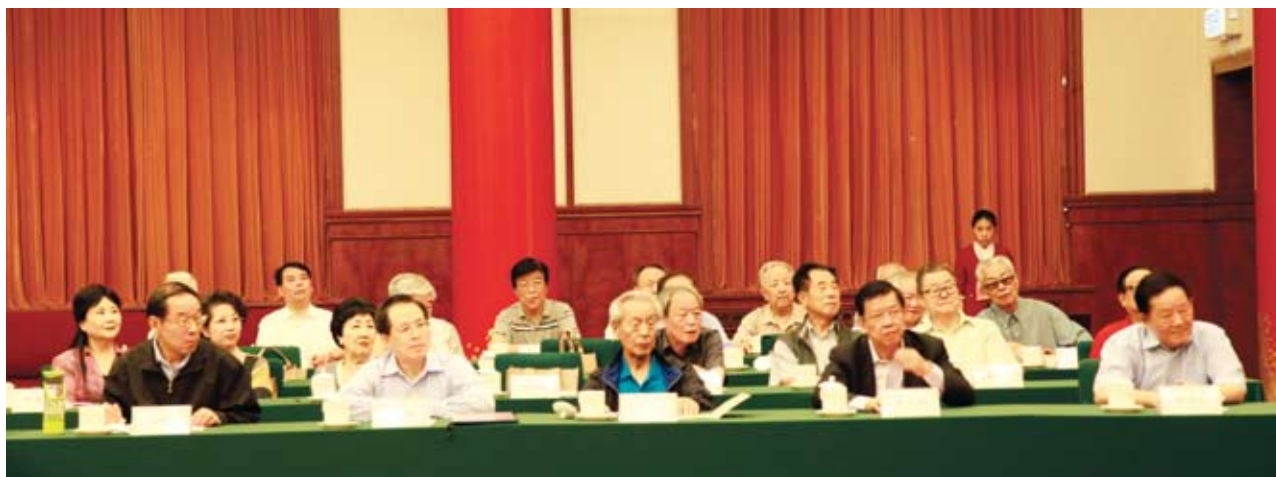
在主宾席上就座的领导（前排左起）：刘志峰、陈兰通、乌杰、龙永图、李德水。