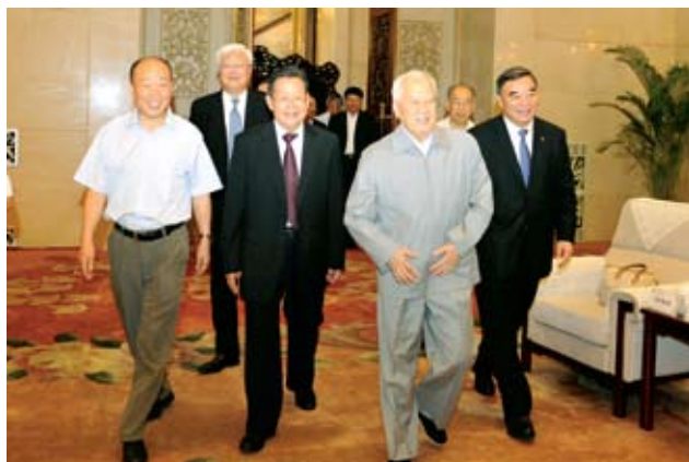
陈锦华等领导步入会见厅。