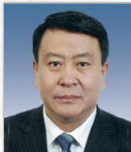
常务副理事长 徐和谊 北京汽车集团有限公司党委书记、 董事长