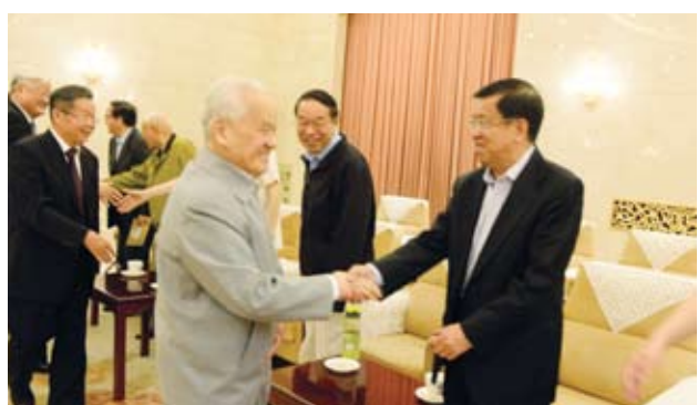
陈锦华与龙永图亲切握手。