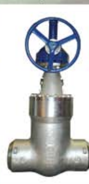
加氢裂化装置专用 内压自密封闸阀