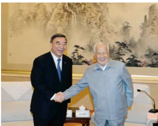
陈锦华与宋志平亲切握手。