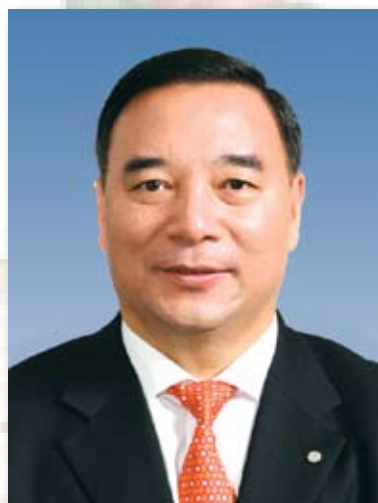
理事长 宋志平 中国建筑材料集团有限公司党委书记、董事长