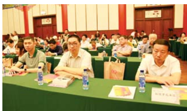
出席座谈会的企业家。