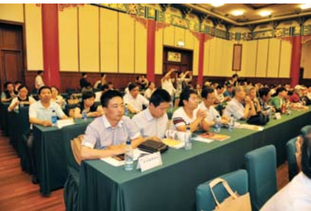
出席座谈会的企业家。