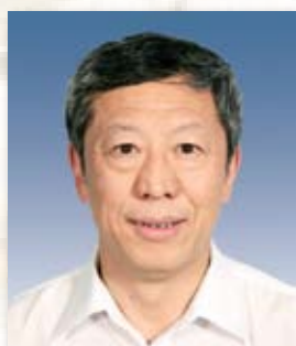
常务副理事长 曾玉康 中国石油天然气集团公司原党 组成员、副总经理