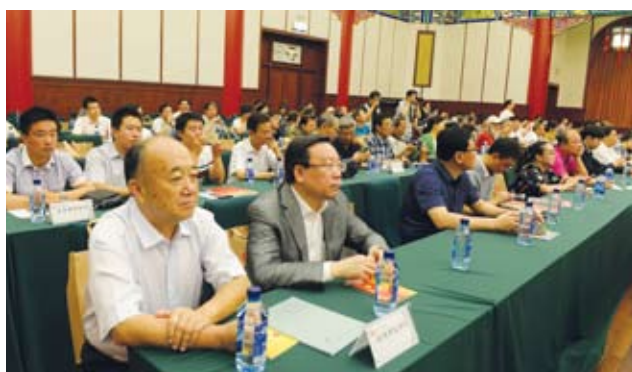
出席座谈会的企业家。