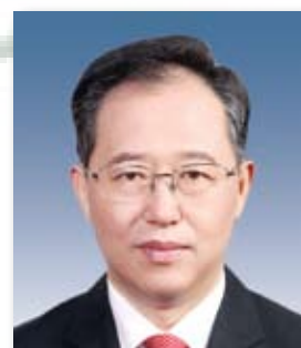
常务副理事长 吕波 中国海洋石油总公司党组成员、 副总经理