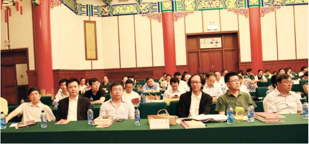
出席座谈会的企业家和兄弟社团组织代表等。