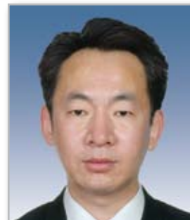
常务副理事长 靳伟 首钢总公司党委书记、董事长