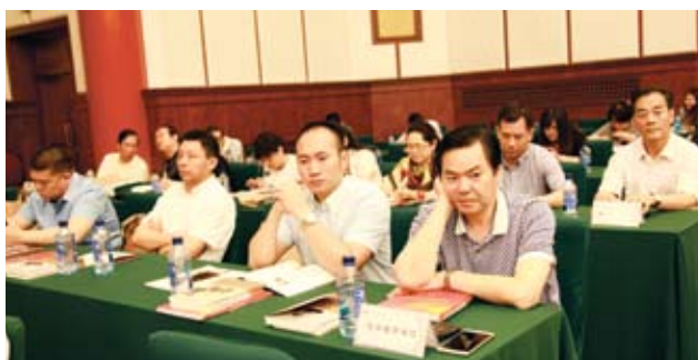
出席座谈会的企业家。