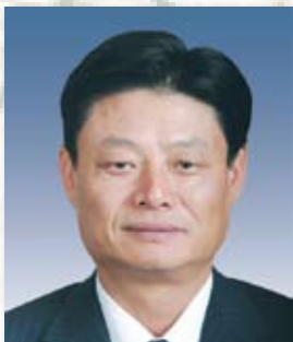
常务副理事长 洪崎 中国民生银行董事长、代行长