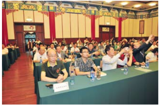
出席座谈会的企业家等。