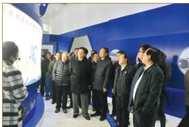
出席论坛的领导及企业家参观河北养元智汇饮品有限公司。