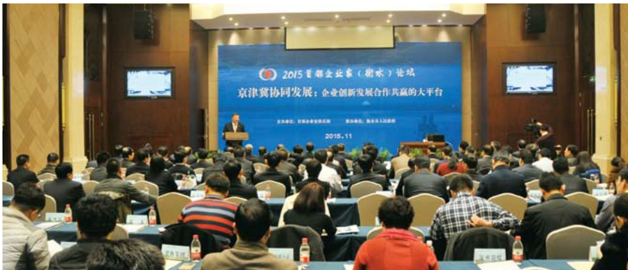
2015首都企业家（衡水）论坛会场。

这次活动中，首都企业家俱乐部向衡水市政府赠送一幅《衡水赋》书法作品。衡水市政府向首都企业家俱乐部回赠一幅武强县年画，作为友好纪念。