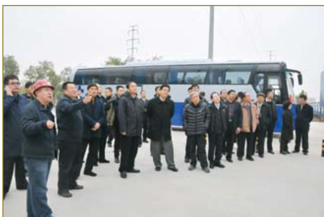
出席论坛的领导及企业家参观“蓝火计划”衡水基地。