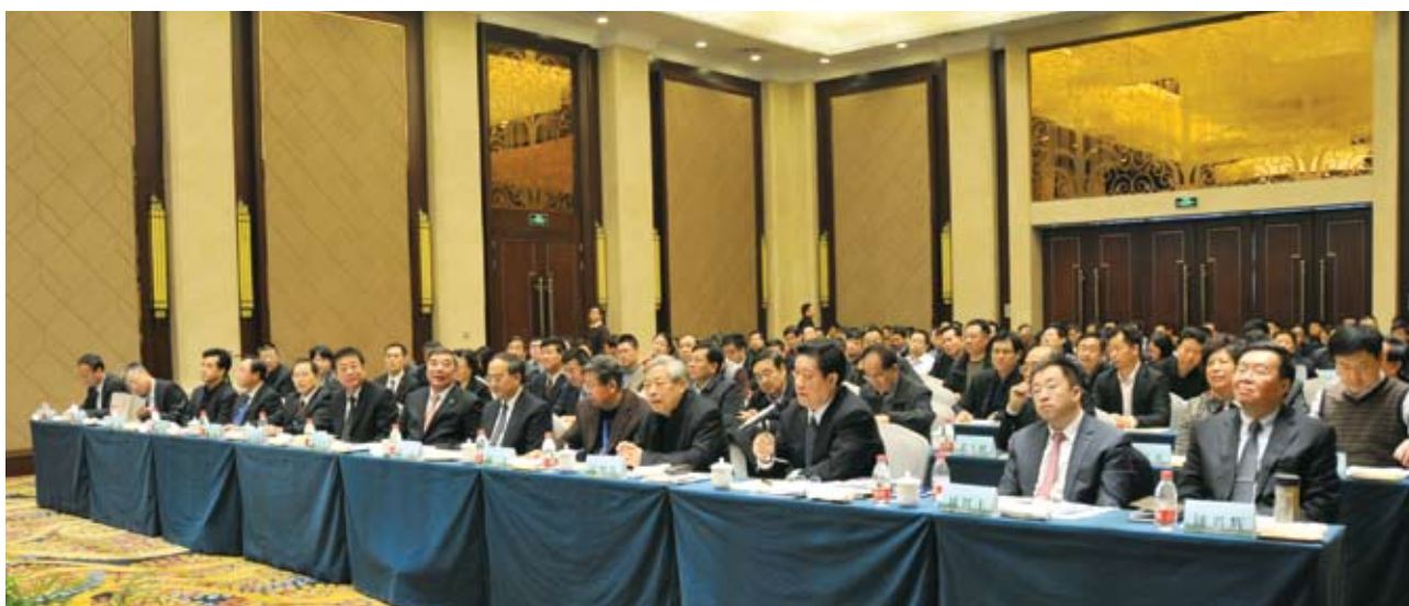
出席论坛的领导、企业家及各界人士。