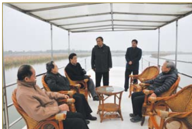
出席论坛的领导及企业家参观衡水湖。