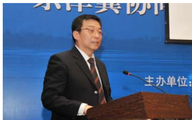
中共衡水市委常委、市政府常务副市长吕志成讲话。