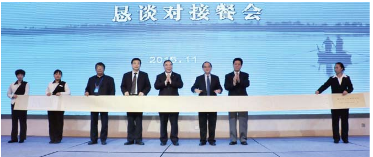
首都企业家俱乐部向衡水市赠送了一幅《衡水赋》书法作品。