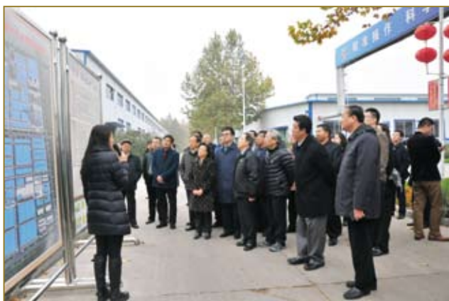
出席论坛的领导及企业家参观衡水老白干酿酒（集团）有限公司。