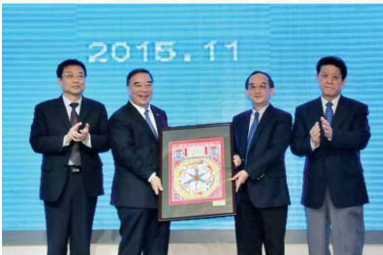
衡水市向首都企业家俱乐部回赠一幅武强年画。