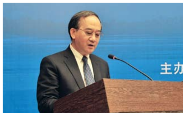
中共衡水市委副书记任民在论坛上致辞。