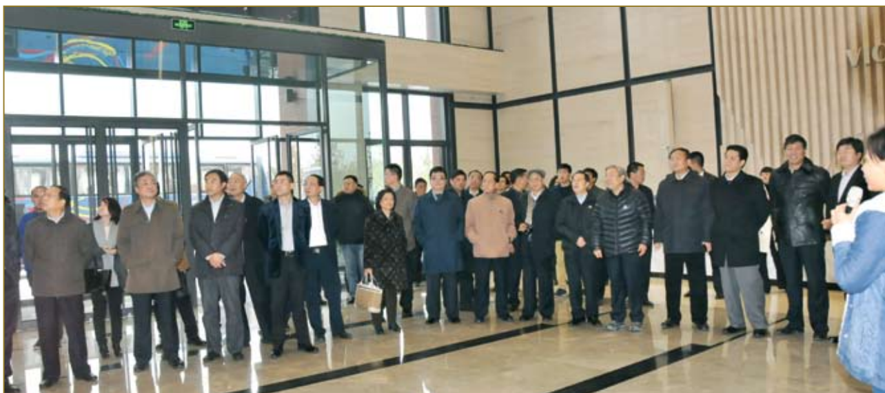
出席论坛的领导及企业家参观河北格雷服装创意产业园。