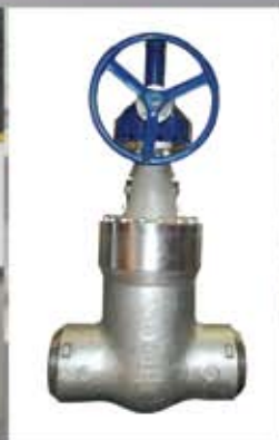
加氢裂化装置专用 内压自密封闸阀