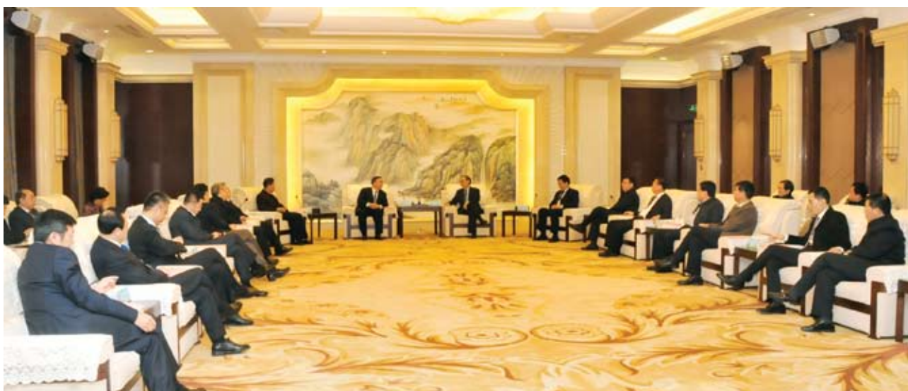
会前，首都企业家俱乐部领导、企业家代表与衡水市领导进行了友好会面和座谈。