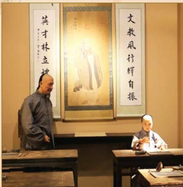
乡塾儒教情景再现。

近年来，集团围绕“活力社区、和谐十里”的服务理念，深入学习儒家文化经典，着力打造了“孝、商、和、智、廉”五大服务理念，2014年，集团投资600万元，以国学文化为主题，建成了占地30亩的孔子文化广场，高达9·5米的孔子铜像威立广场中央，周边环境环绕了6根孝经石柱，还浮雕了24孝的故事内容。使这座文化广场成为了兼具文化教育、社区服务、居民休闲的标志性建筑。还建立了孔子学堂，定期邀请专家讲授《朱子家训》。