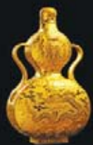
福禄万代传家宝瓶

在未来的发展中，国金黄金仍将积极践行“改变、创新、超越；诚信、责任、实干”的核心价值观，牢固树立“全心全意为客户提供高品质服务”的企业宗旨，努力与所有合作伙伴一道，共同开拓贵金属文化艺术领域更加美好的未来