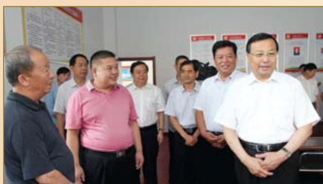
临沂市委书记林峰海(右二)检查社区人民调解工作。