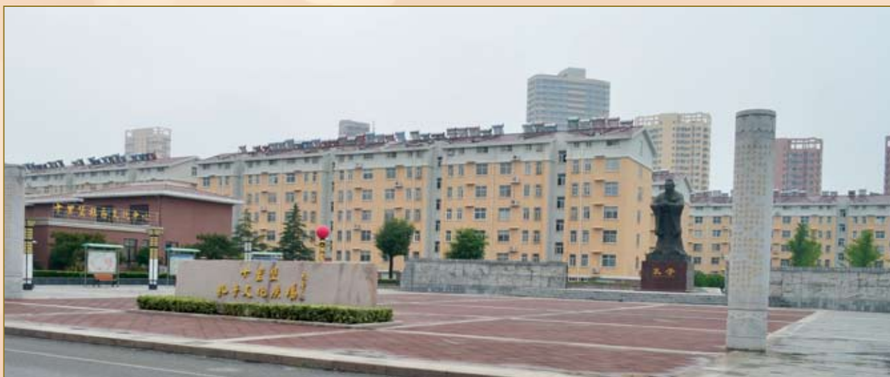
十里堡社区孔子文化广场。