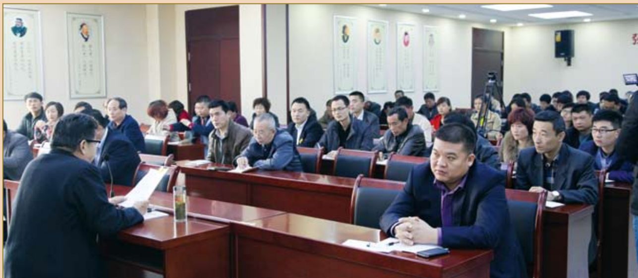
专家讲授《朱子家训》。