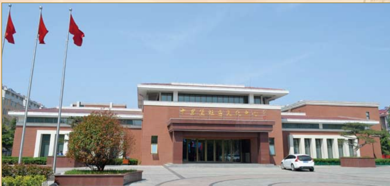
十里堡社区文化中心。

山东临沂罗庄区十里堡社区是首都企业家俱乐部会员单位山东金谷泉集团有限公司驻地，近年来，集团坚守文化自信，统筹“两个文明”，在十里堡这个闻名鲁南的、具有600多年的古镇上营造了浓厚的文化氛围，让2000多户、6000余名社区居民浸润在精神文明的陶冶之中。目前，十里堡社区已经形成和正在完善的文化设施有：中国首家社区汉字体验馆、中华偏方一条街、山东省非遗传承示范点、山东最早乡村记忆馆、鲁南民俗风情村、鲁南非遗集散地、临沂文化旅游示范点、临沂汉字教育基地、临沂重点商业项目。