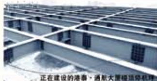
正在建设的港泰·通航大厦楼顶停机坪