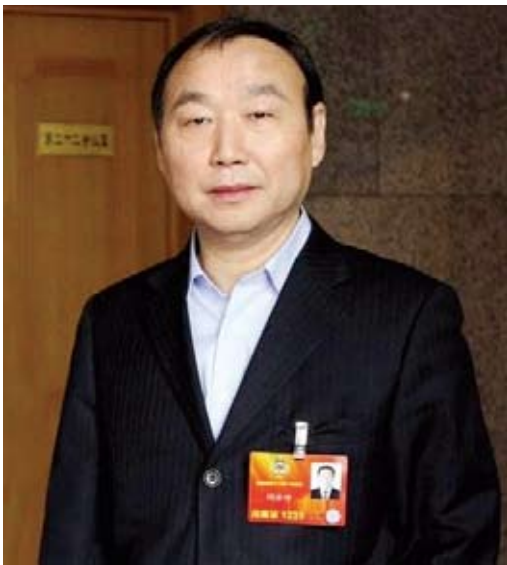
闫冰竹 首都企业家俱乐部原副理事长、12届全国政协委员、北京银行原董事长

推动政府和社会资本合作（PPP）模式，是今年两会关注的重点之一。我在“关于进一步创新政府和社会资本合作模式，提升经济增长活力”的提案中谈到，为进一步推进PPP模式发展，首先要为其提供可靠的制度和法律环境。