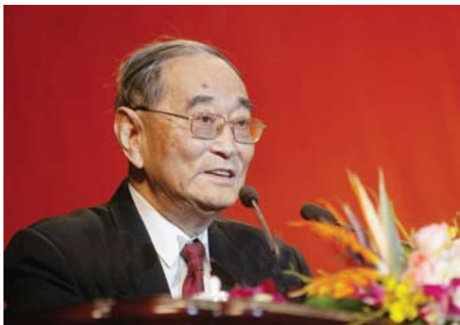
厉以宁 首都企业家俱乐部顾问、12届全国政协委员