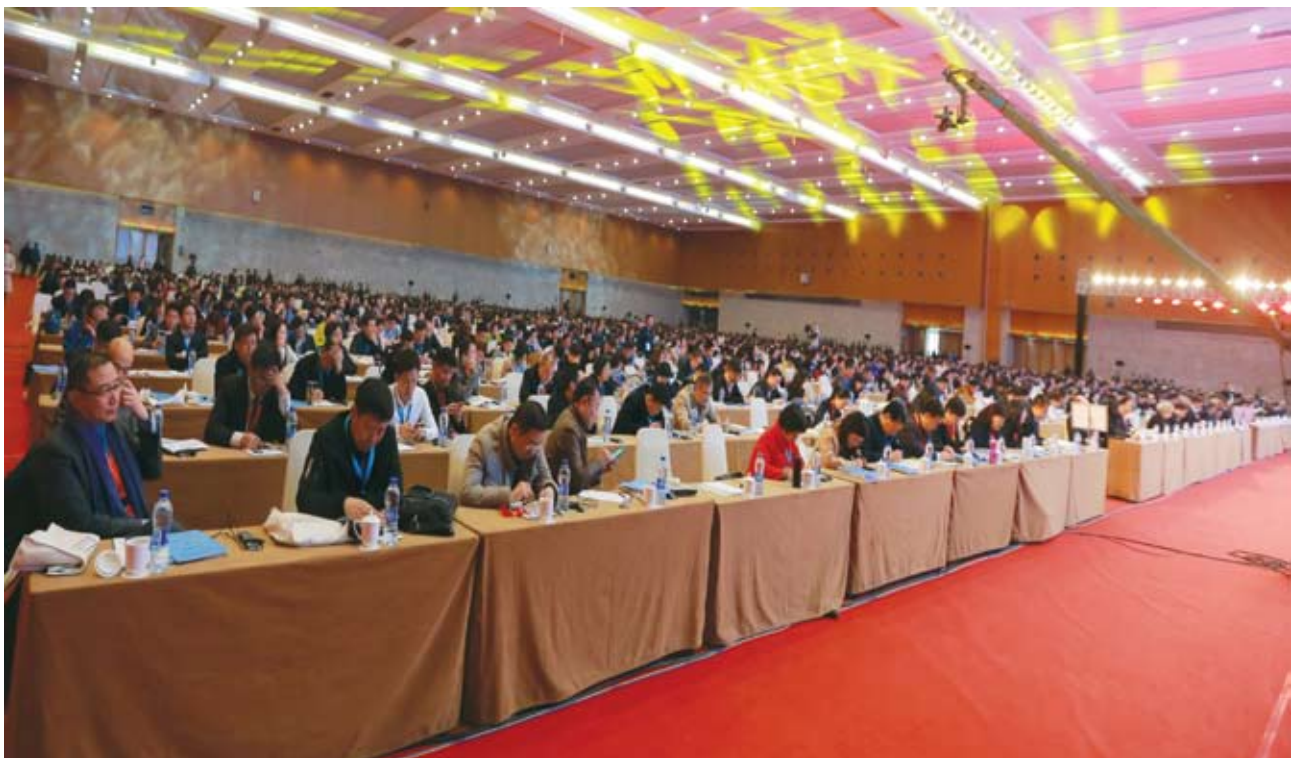
2017中国企业走出去风险发布会会场