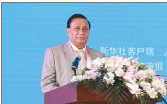
斯里兰卡驻华大使卡鲁纳色那·卡迪图·瓦库进行《斯里兰卡招商引资与投资商机》发布

斯里兰卡驻华大使及来自希腊、墨西哥、匈牙利、西班牙、比利时、厄瓜多尔、拉脱维亚、埃塞俄比亚驻华使领馆代表、中国电建、招商银行、马来西亚CIMB银行；意大利GOGA、欧华、富高、致同、谢凯文律师或会计事务所等机构的权威人士分别从各国招商政策与投资商机、海外承包机遇与挑战、海外风险及保险管理、汇率风险及海外投资、本地商务代理服务、专业安保服务、商旅救援、税务合规、医疗救援、尽职调查等问题进行了现场发布。围绕论坛主题，聚焦全球投资贸易服务过程中，特别是中国企业走出去过程中面对的各种风险和亟待解决的问题，并对中国企业如何提高海外的工作效率展开了深入探讨和交流。