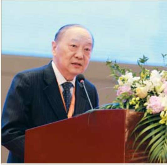
中国产业海外发展协会会长胡卫平讲话