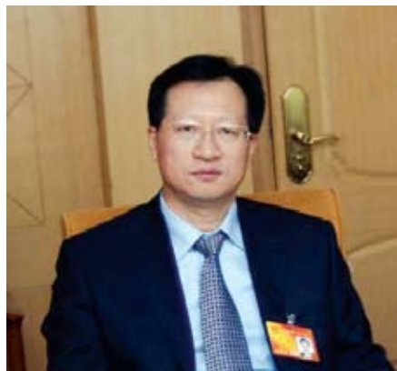
陈立国 首都企业家会员单位、12届全国人大代表、中国石化北京石油公司总经理