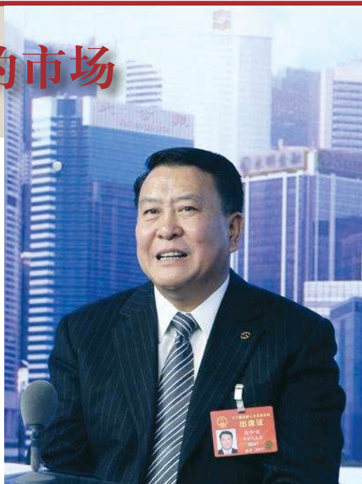
徐和谊 首都企业家俱乐部常务副理事长、12届全国人大代表、北京汽车集团董事长