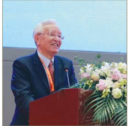
中国国际经济交流中心副理事长张国宝致辞