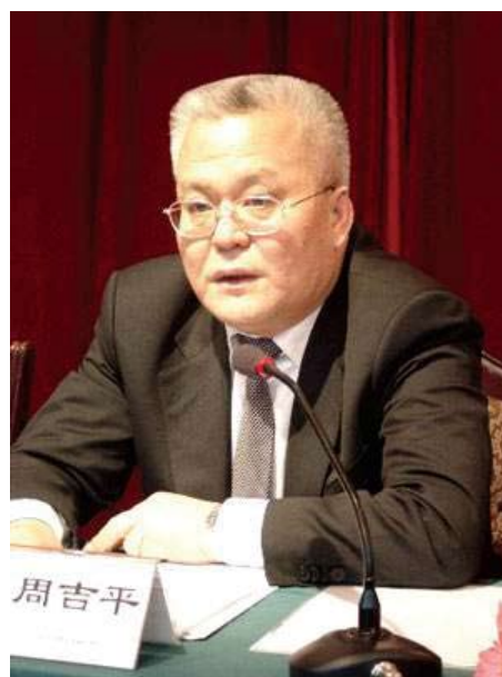
周吉平 首都企业家俱乐部会员单位中石化原董事长、12届全国政协委员

我对中国油气企业参与“一带一路”建设，提出五项发展建议：加强能源外交，加强设施联通，争取能源话语权，加大产融结合，推动合作本地化。