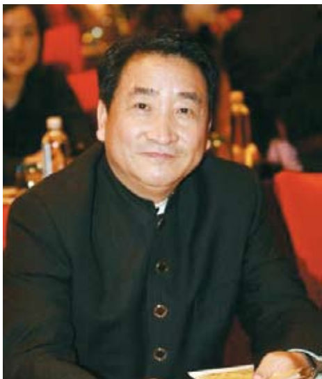
姜昆 首都企业家俱乐部特邀理事、12届全国政协委员、中国曲艺家协会主席

近年来，中国曲艺界认真落实习总书记系列讲话精神，说唱百姓，服务大众，传播中国价值、弘扬中国精神，充分展示了曲艺艺术在反映百姓生活、抒发美好理想、引领社会风尚等方面不可替代的作用。