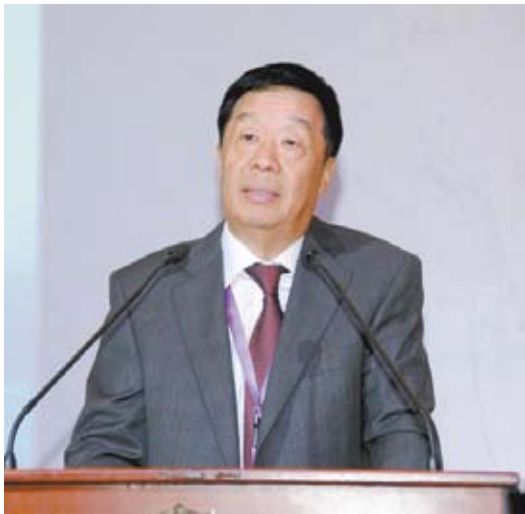
马泽华 首都企业家俱乐部会员单位中国远洋运输集团总公司原董事长、12届全国人大代表

服务业是能够为社会创造重大价值的领域，服务业分了很多很多类别。原来我所从事的是远洋运输行业、就是属于物流业范畴，我认为中国的物流业有广泛的基础，理所当然地应该得到更好的发展。