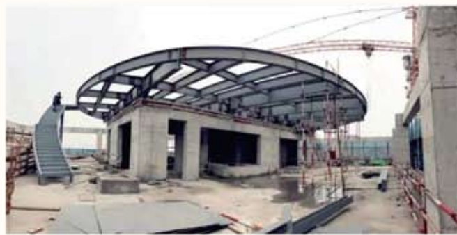
正在建设的港泰·通航大厦楼顶停机坪