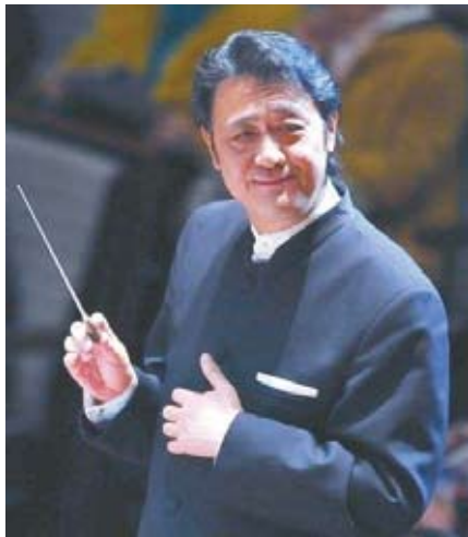
谭利华 首都企业家俱乐部特邀理事、12届全国政协委员、中国音乐家协会副主席

中华民族自古以来是一个讲求礼数的民族。近一段时期出现的不文明出行行为已严重影响了其他国家人民对中国的正确认识，损害了国家形象。他认为，提高国民素质已经成为目前急需解决的首要问题，建议各级政府部门制定相关措施遏制不文明行为，社会各界和新闻媒体加大对于文明出行的宣传力度。