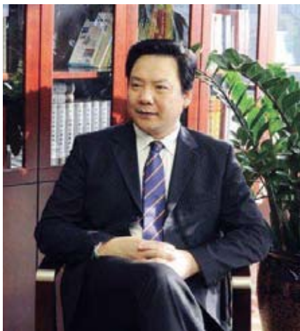
陈雨露 首都企业家俱乐部 顾问、12届全国人大代表、 中国人民银行副行长

我国经济至今仍未完全企稳，延续了金融危机以来实施的货币宽松政策。由于货币市场盈利空间较大，导致大量资金在金融领域“空转”，没有流向实体经济，而解决这个问题的有效办法，就是提高公开市场利率、压缩货币市场的盈利空间。因此在全球货币政策趋紧之时，央行通过提高公开市场操作利率进行适度微