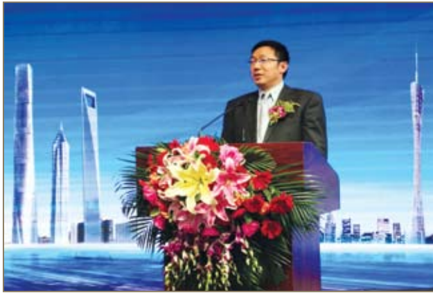
王兵董事长发表演讲。