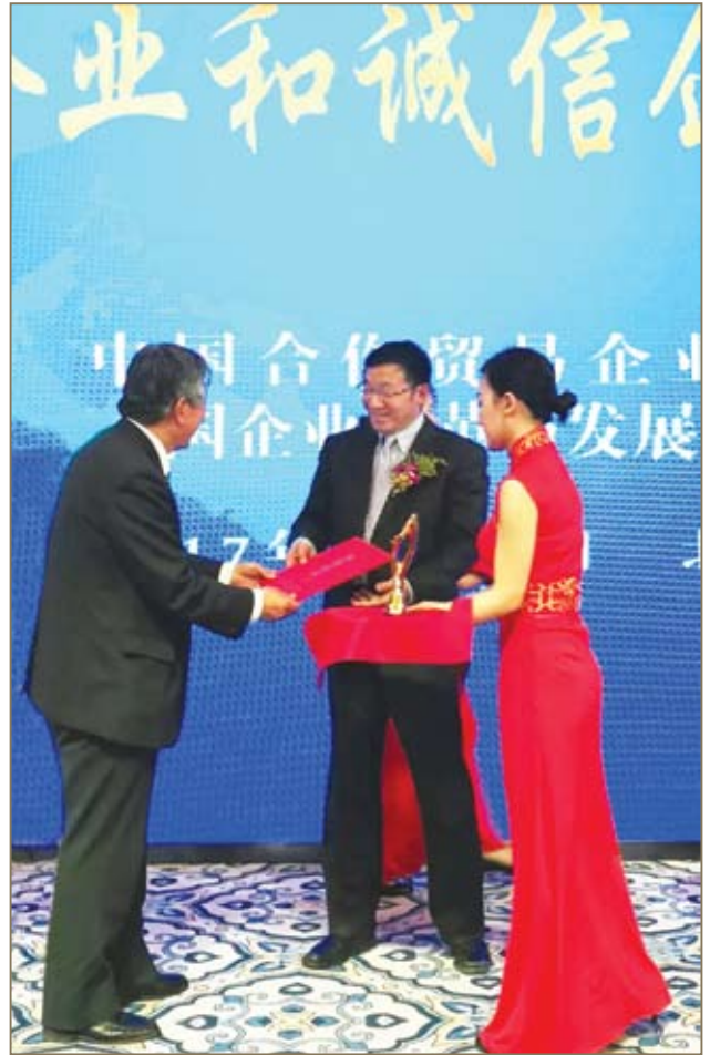
王兵董事长接受证书和奖杯。