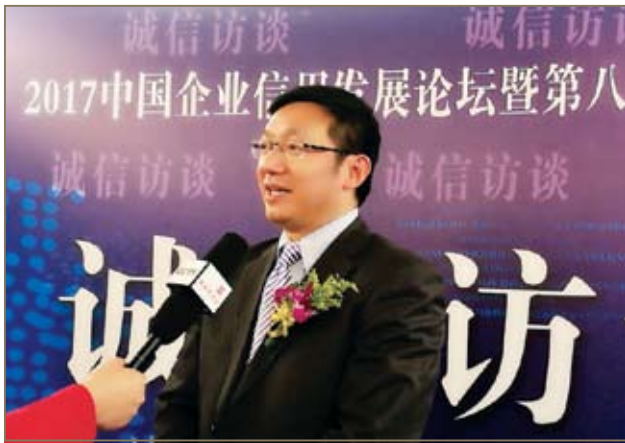
王兵董事长现场接受中央电视台专访。