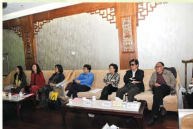
《相约春天》活动现场。