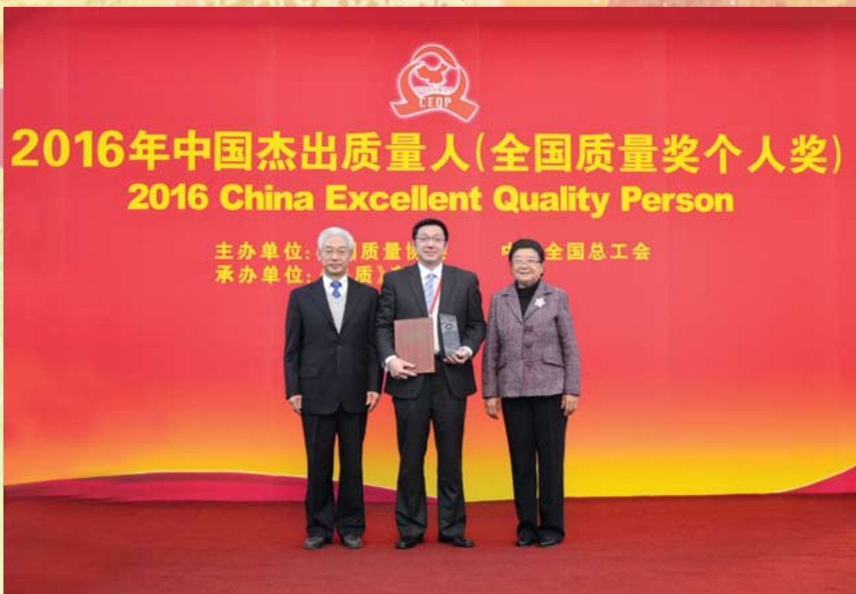
全国人大原副委员长顾秀莲（右）、中国质量协会会长贾福兴（左）为王兵（中）颁奖后一同合影。

12月14日，2016年“中国杰出质量人（全国质量奖个人奖）”颁奖庆典在北京钓鱼台国宾馆举行，北新集团建材股份有限公司董事长、首都企业家俱乐部主任王兵荣膺“2016年中国杰出质量人（全国质量奖个人奖）”。十届全国人大副委员长顾秀莲；九届、十届、十一届全国政协副主席白立忱；中国质量协会会长贾福兴等领导出席大会并为获奖者颁奖。