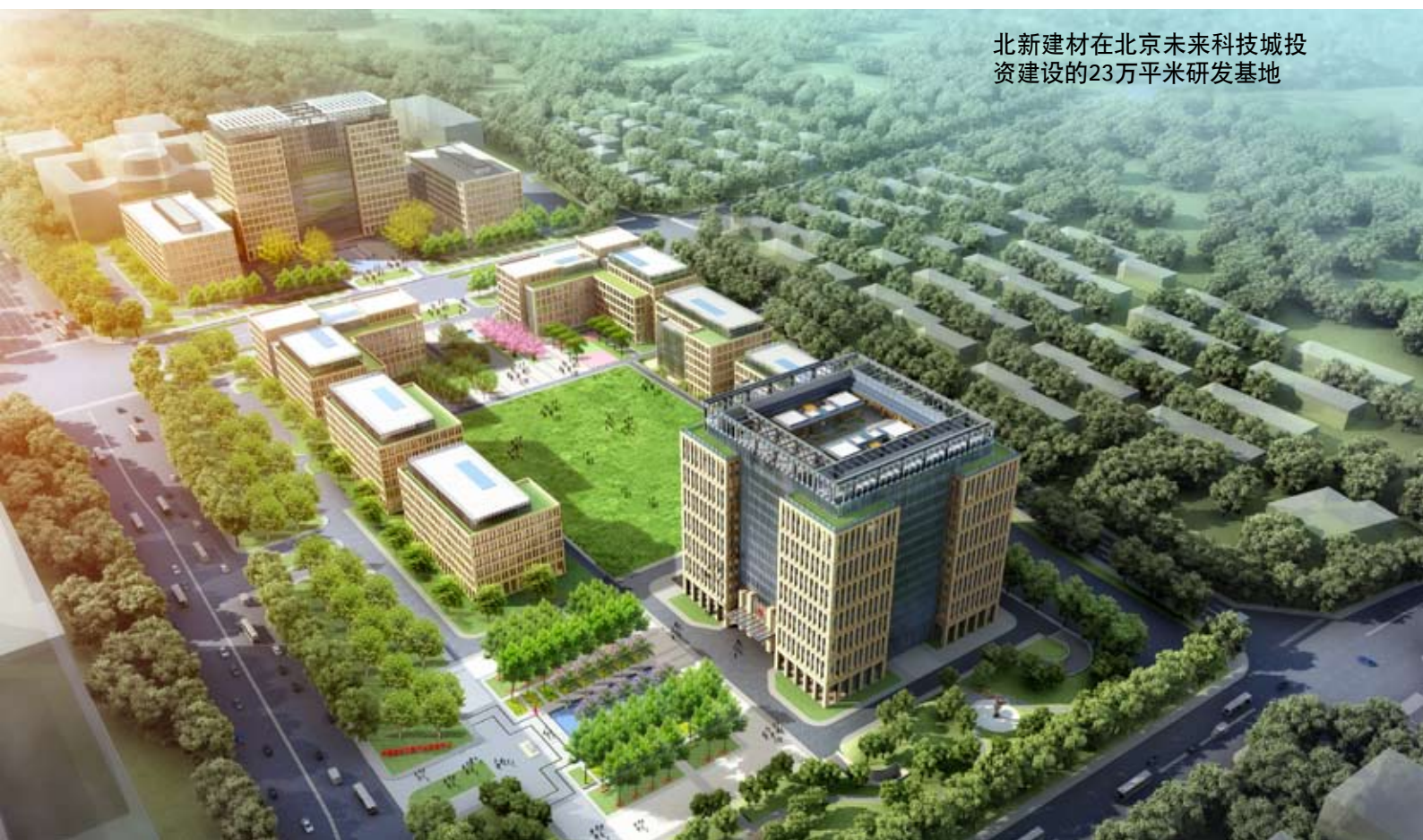
北新建材在北京未来科技城投资建设的23万平米研发基地