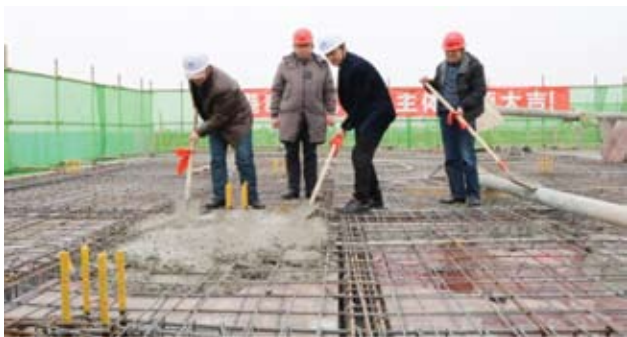
港泰·通航大厦主体封顶现场

昨天，即12月29日，随着成都港泰·通航大厦房顶最后一块混凝土浇筑完毕，这座位于市中心的主体建筑结构正式封顶。按照计划，成都首座通航产业服务中心将于2018年底完成施工并正式投入运营，开启蓉城乃至西南商务“高效化”时间。