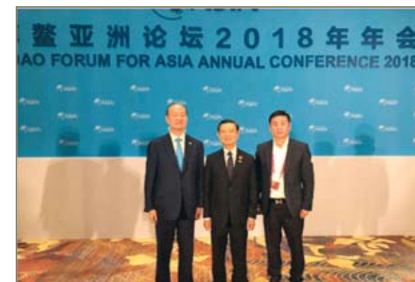
胡智荣、于朝阳与新加坡前副总理黄根成（中）合影。