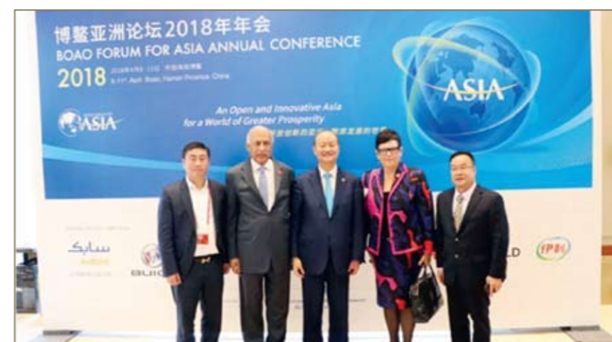
胡智荣、于朝阳与新西兰前总理珍妮·希普利女士、巴基斯坦前总理阿齐兹合影。