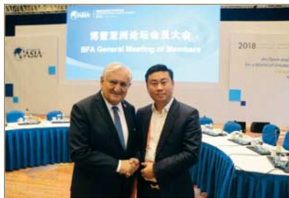
于朝阳与法国前总理拉法兰合影。