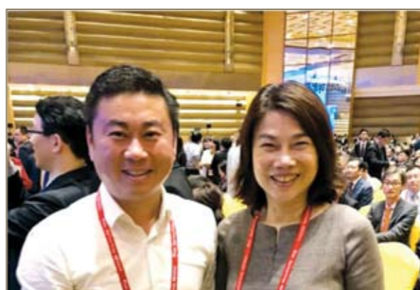
于朝阳与著名企业家董明珠合影。