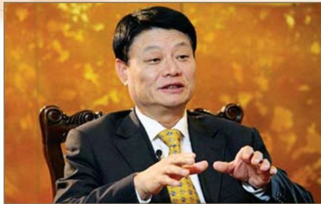
首都企业家俱乐部常务副理事长、中国民生银行董事长洪崎被《银行家杂志》评选为2017中国十大金融人物

2017年初，延宕两年，民生银行董事会完成换届，洪崎继2014年中途接任后连选连任。在第一个完整的董事长任期的第一年，他所擘画的转型战略开始整体浮出水面，尘埃落定的民生银行终于锁定航向，再度扬帆起航。这一年，他年届六十，已为民生银行工作22年。