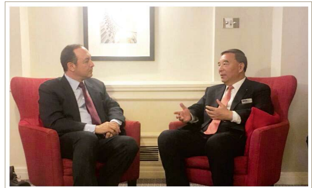
宋志平主席听取了世界水泥协会筹委会主任、海德堡全球贸易CEO、新当选的世界水泥协会执委会主任埃米尔的工作汇报，并就协会工作作出指示。