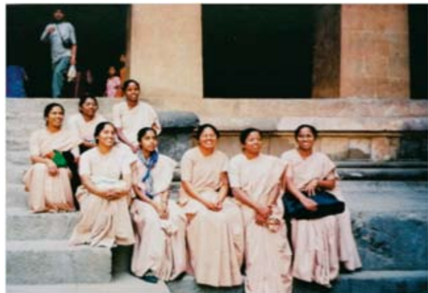
《印度妇女》——2002年12月摄于印度孟买