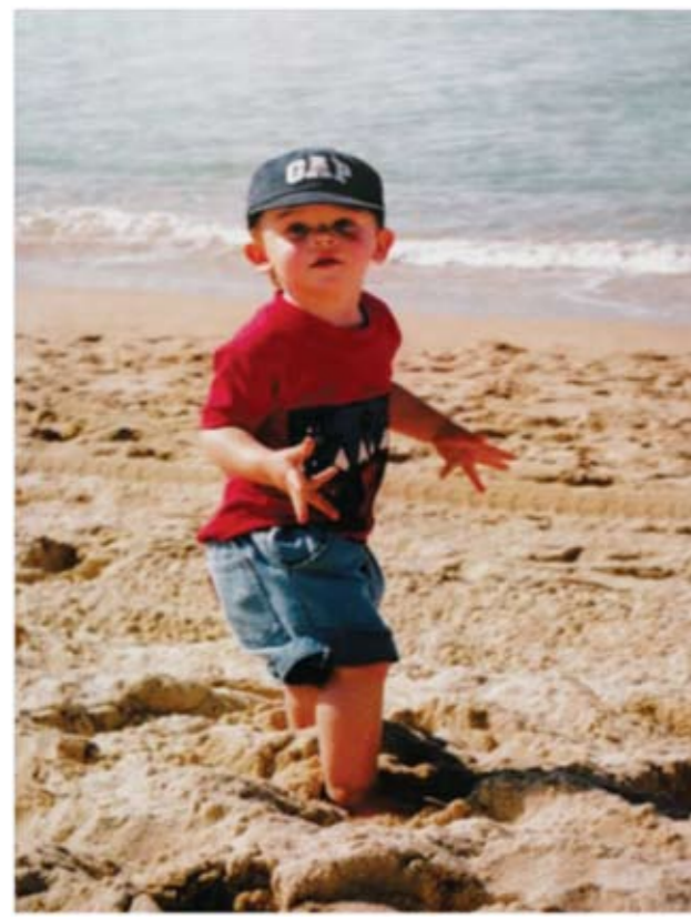
《玩沙》——2000年9月摄于澳大利亚邦迪海滩