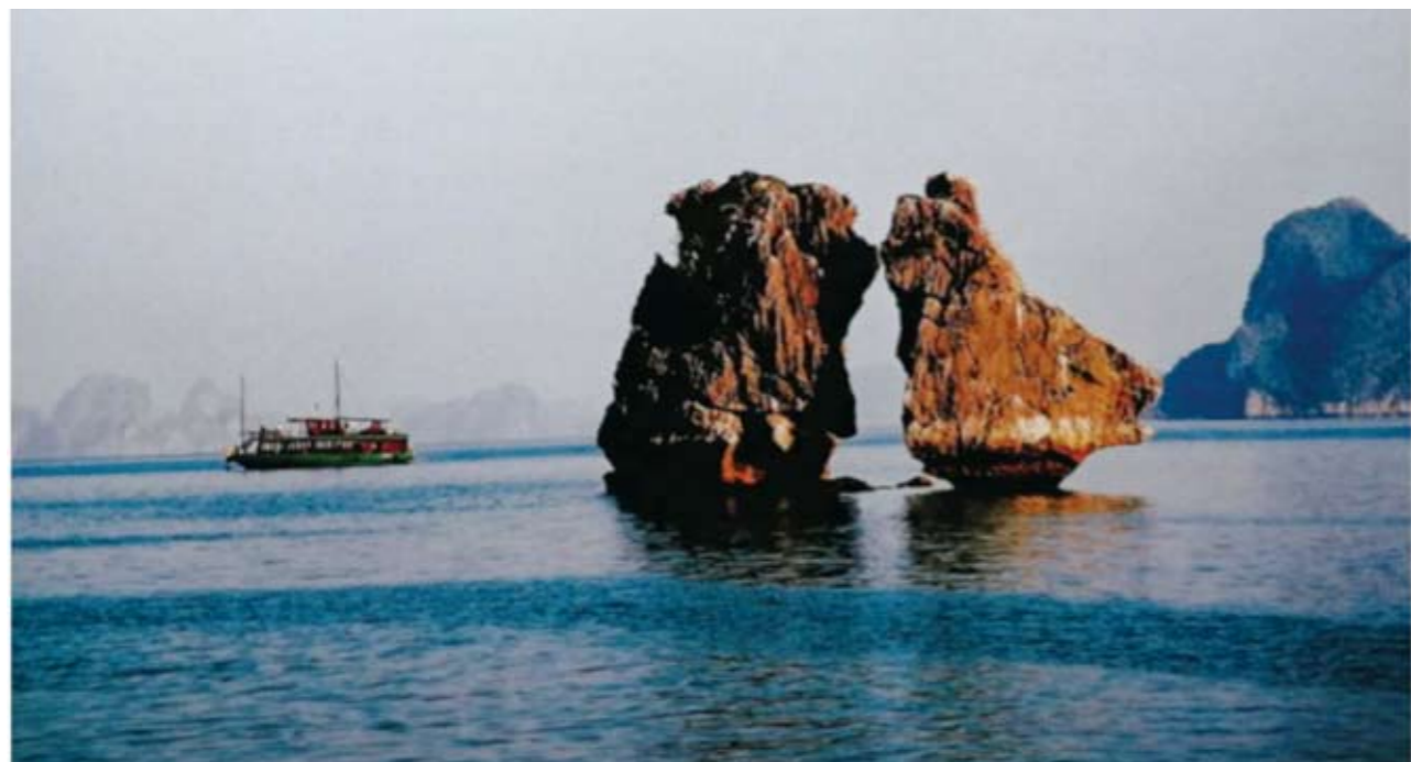
《斗鸡》——2004年12月摄于越南下龙湾