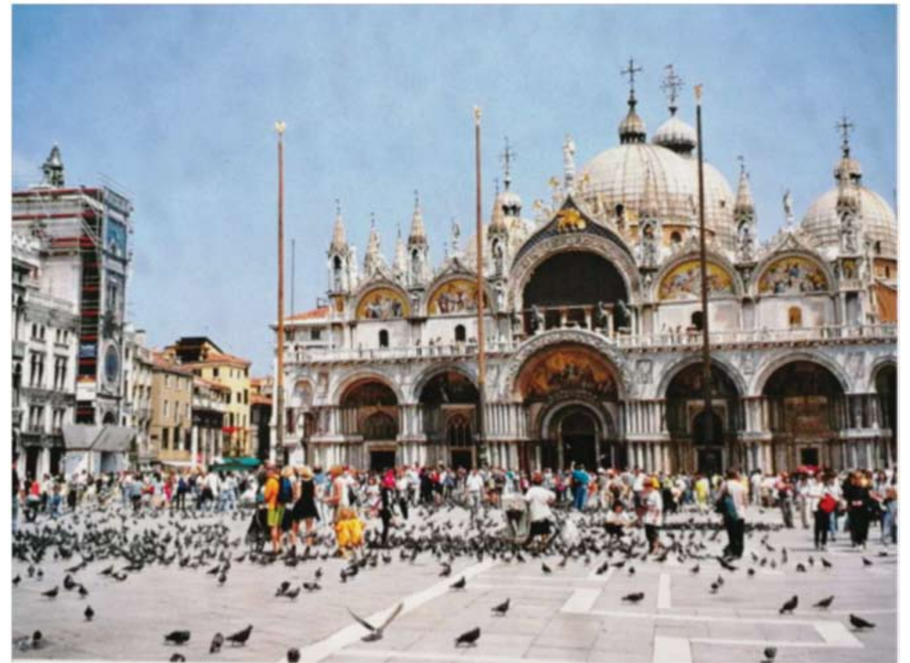
《圣马可广场》——1998年5月摄于意大利威尼斯