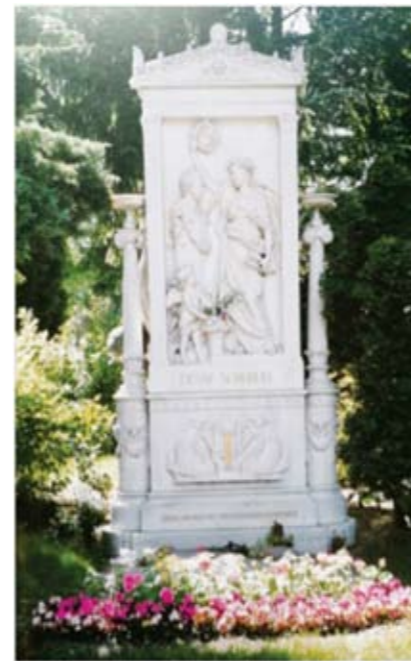
《安息的音乐家——舒伯特之墓》 ——1998年5月摄于奥地利维也纳