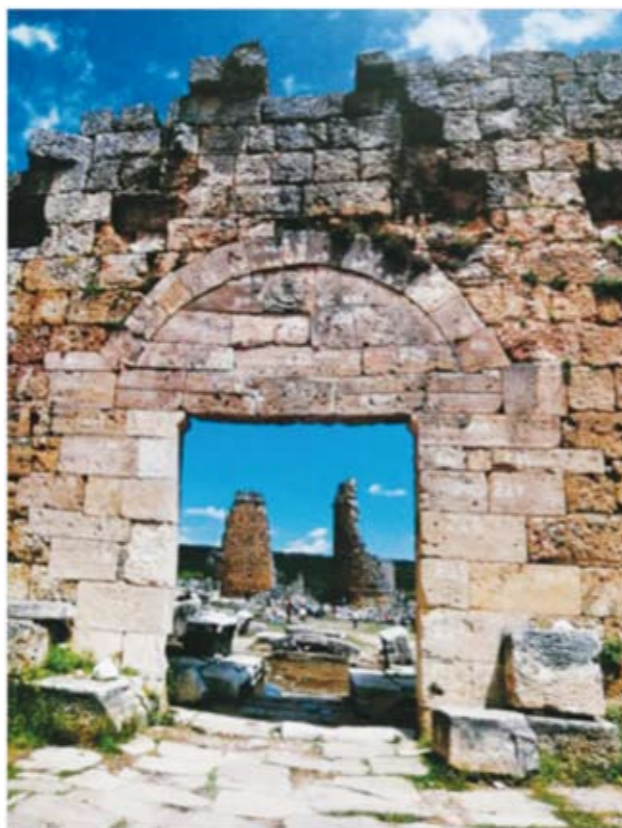
《古罗马浴池遗址》——2004年5月摄于土耳其安塔利亚