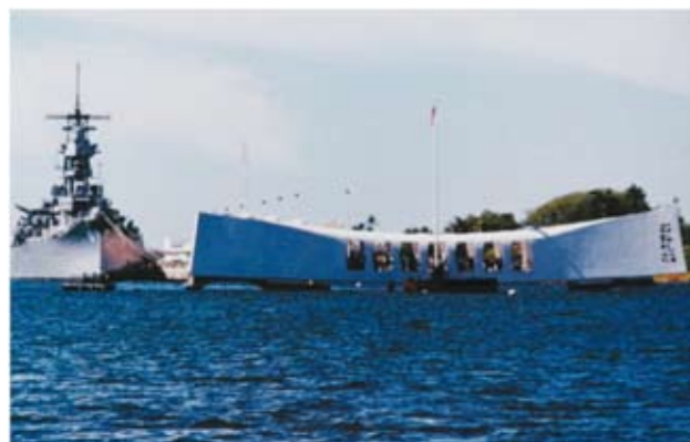
《珍珠港》——摄于美国夏威夷珍珠港