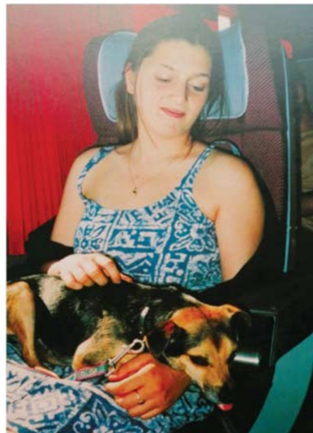
《恬静》——1994年6月摄于巴黎