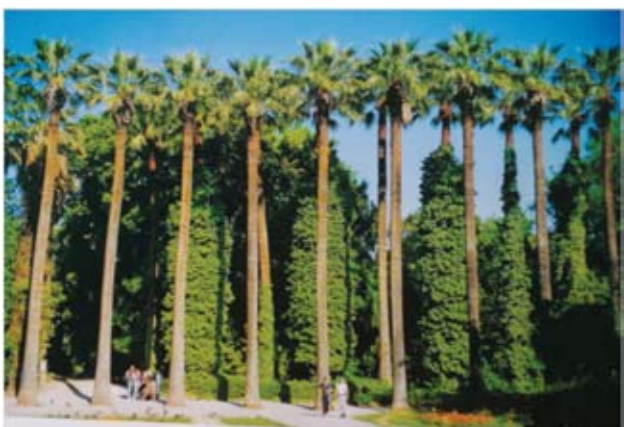
《参天大树》——2000年5月摄于希腊雅典