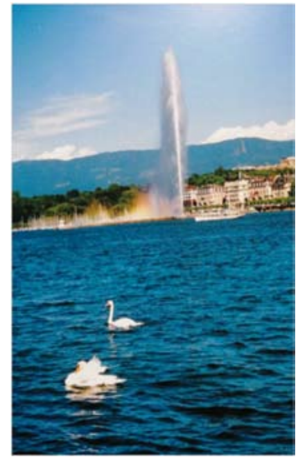
《大喷泉》 ——2002年6月摄于瑞士日内瓦