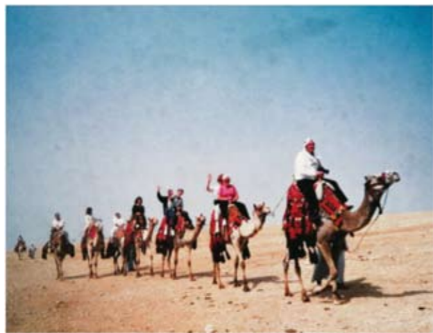
《驼铃》——1992年5月摄于突尼斯古城