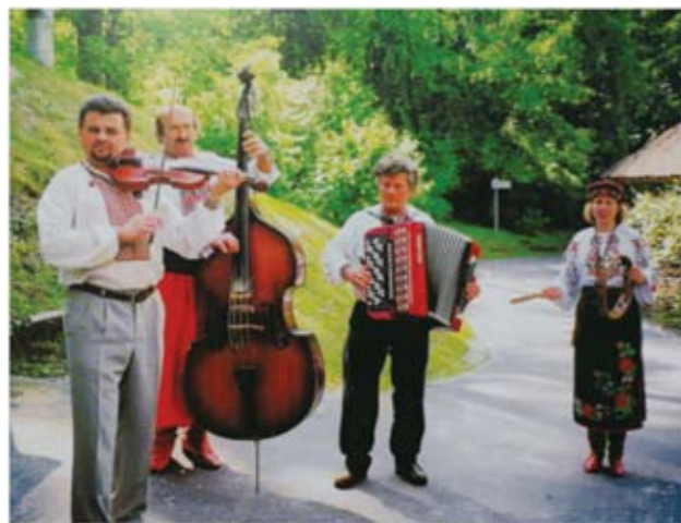
《乡村交响乐》——2000年5月摄于乌克兰