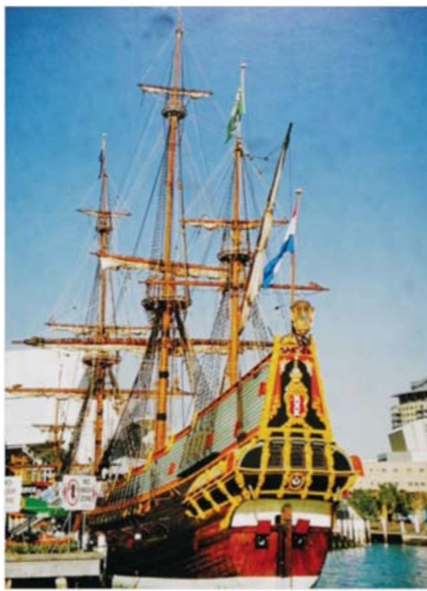
《彩船》——2000年9月摄于澳大利亚