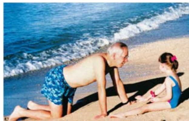
《老人、孩子和海》——1998年10月摄于美国夏威夷