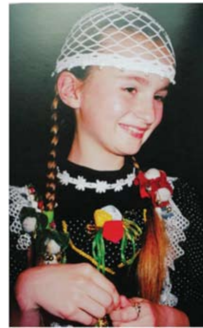
《我是乌克兰最漂亮的小姑娘》 ——2000年5月摄于乌克兰