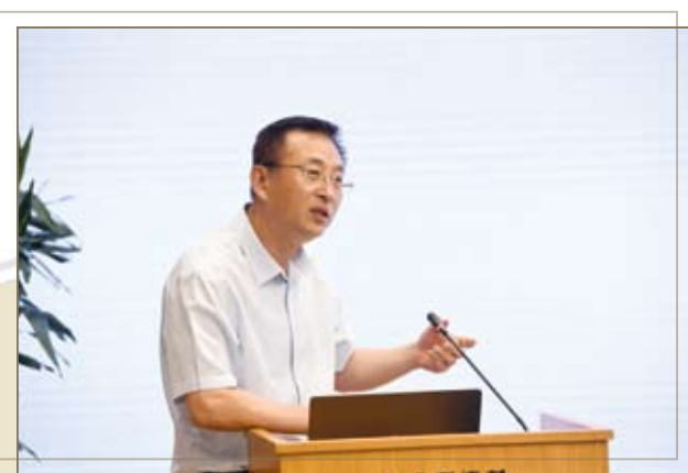
中国技术进出口集团董事长唐毅