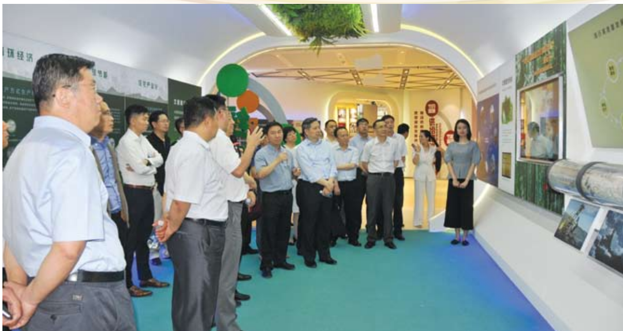
与会嘉宾参观北新建材未来建筑馆