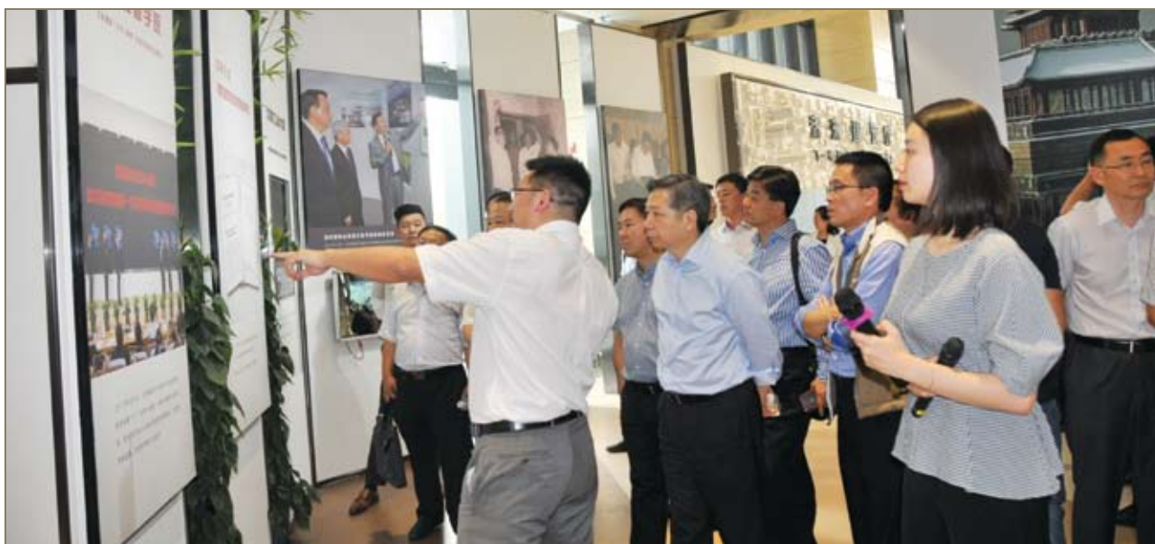
与会嘉宾了解北新建材发展历程