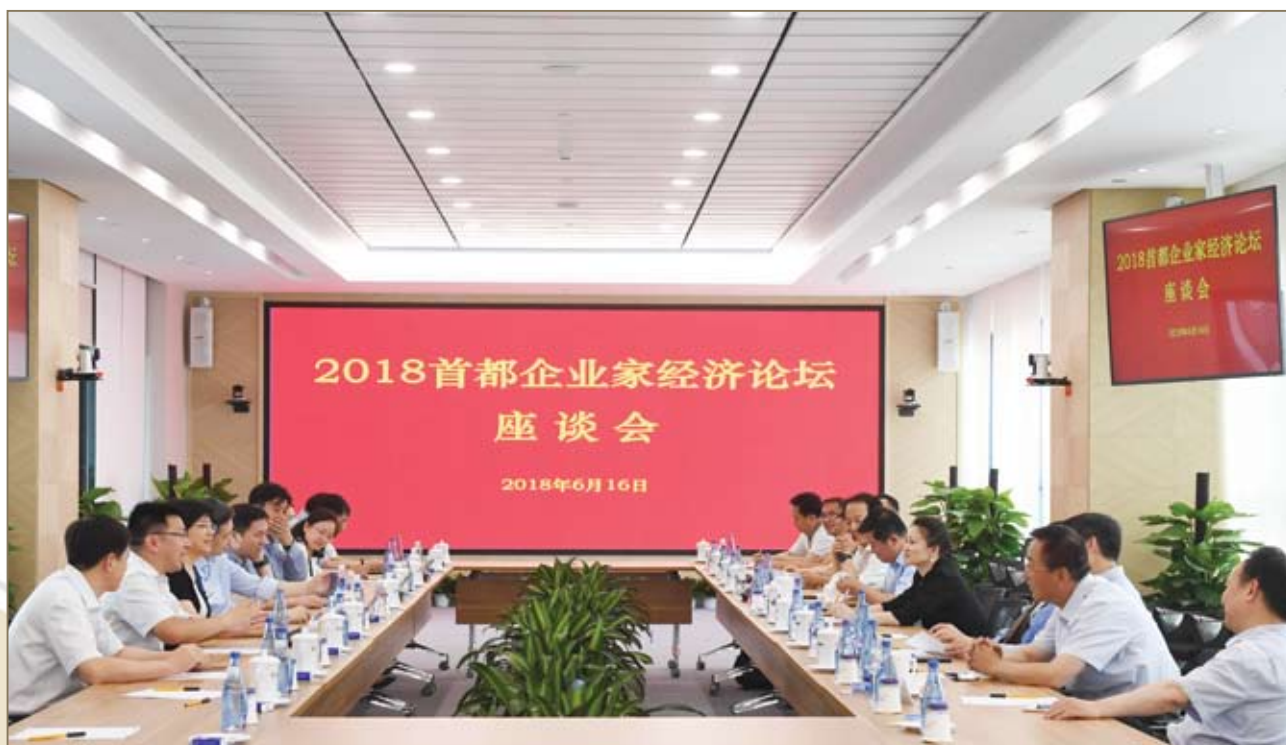
2018首都企业家经济论坛座谈会现场