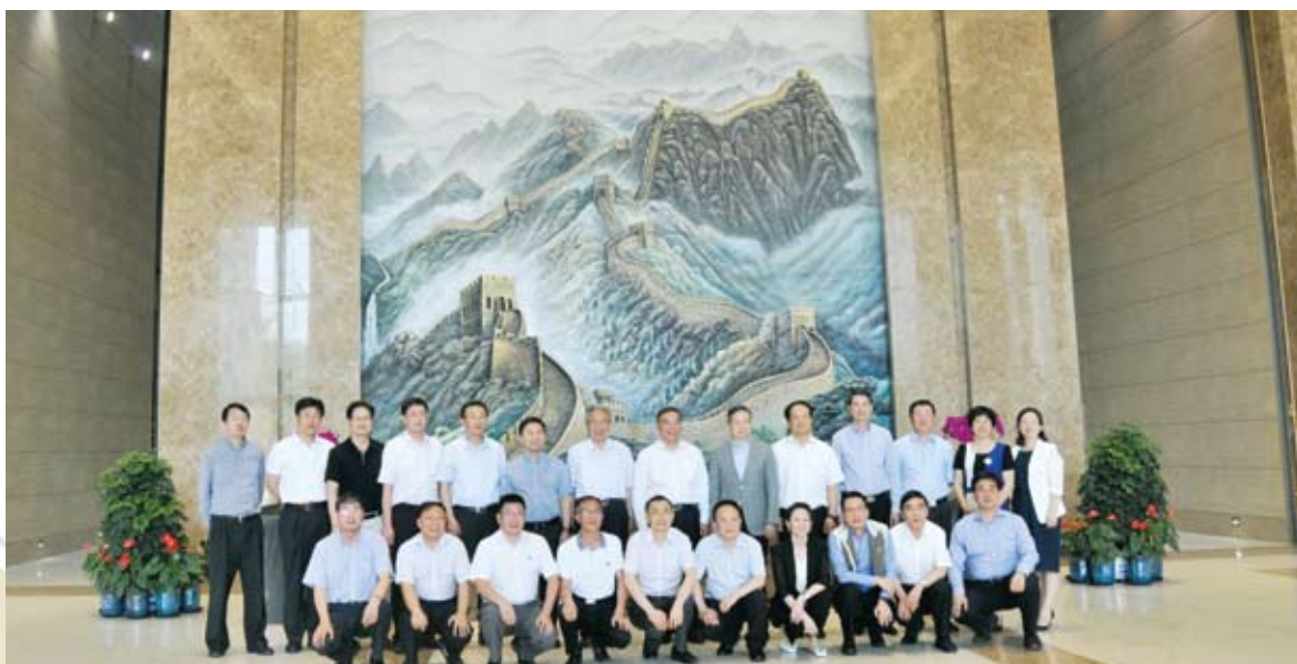
参加论坛的部分嘉宾合影