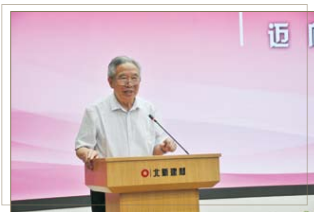
国家行政学院原经济学部主任周绍朋