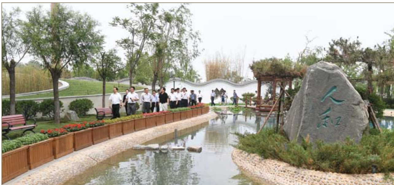
与会嘉宾参观北新建材文化文化园区