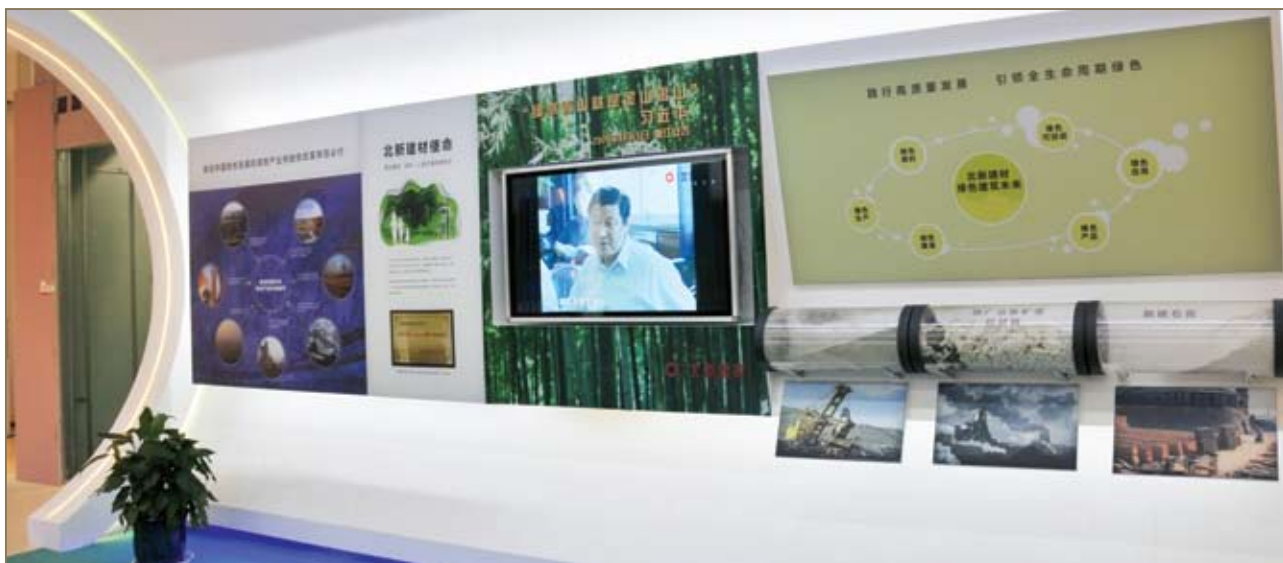
北新建材使命（图版一）