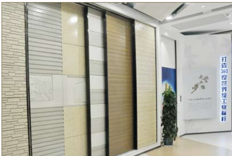
光荣的梦想（图版二）