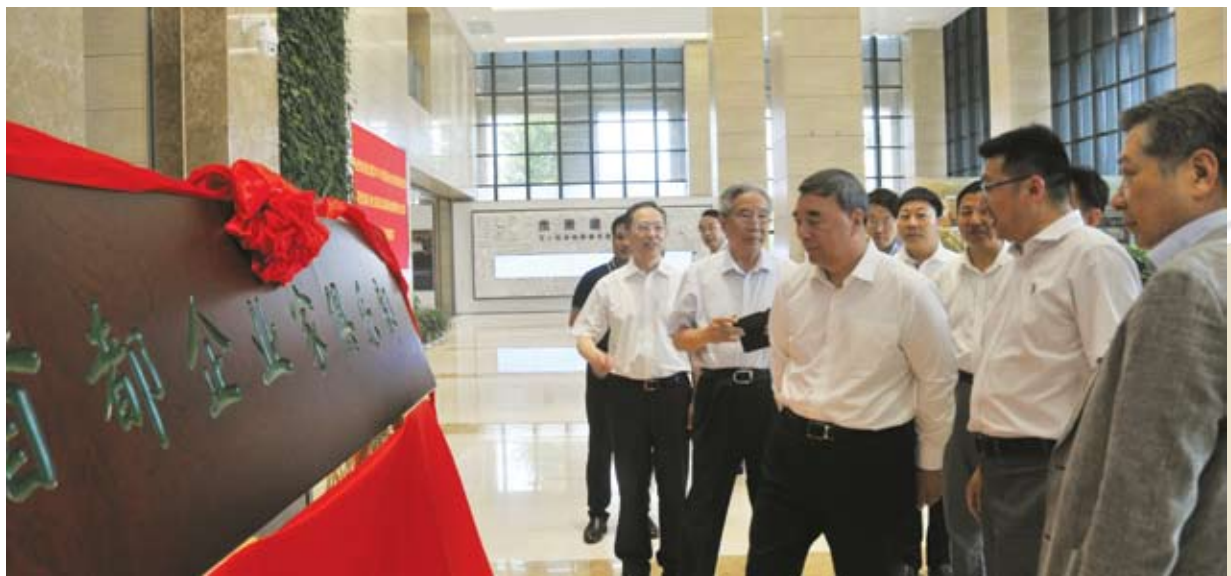
宋志平理事长与部分参会领导驻看首都企业家俱乐部牌匾