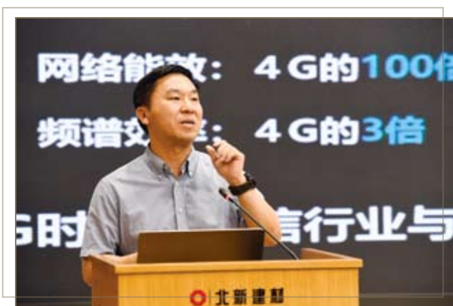
中国电信集团副总经理刘桂清