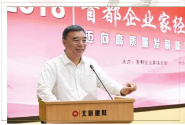
中国建材集团董事长宋志平