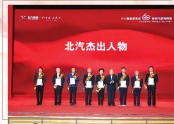
“北汽杰出人物”代表接受表彰

大会全面回顾了北汽六十年砥砺奋进的光辉历史，总结了北汽六十年改革创新的历史经验，提出了面向未来建设“百年北汽”的宏伟目标和实施方略，并对北汽六十周年“功勋人物”“杰出人物”“时代人物”进行了表彰。