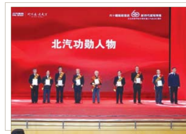
“北汽功勋人物”代表接受表彰

国家发改委、科技部、工信部、国家信息中心相关领导；北京市委、市政府、相关委办局、相关区县领导；外埠相关地方政府领导；解放军相关部门领导；原中国机械工业部、中国企业联合会等相关行业组织领导、专家；相关高等院校、科研单位领导；北汽集团重要合作伙伴、经销商领导；北汽集团领导及各部室、各成员单位负责人，优秀员工代表，离退休老领导、老同志等共一千余人参加了大会。