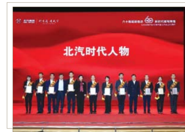
“北汽时代人物”代表接受表彰